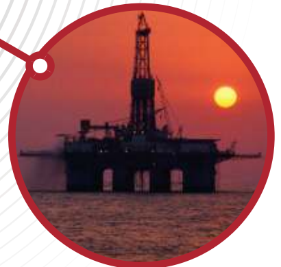
Petróleo / Petroquímica