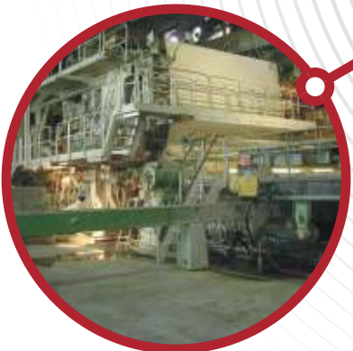
Celulose / Papel